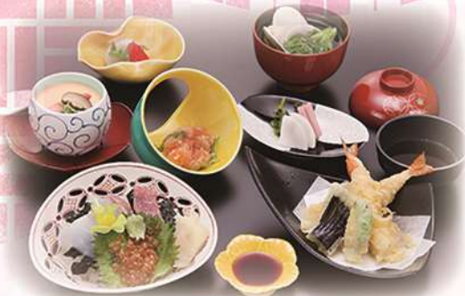
ちらし寿司と天婦羅の御膳 「波の華」 ¥2,860(税込) (本体価格¥2,600)