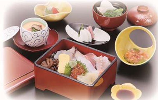
海鮮重の御膳 「浜風」 ¥2,530(税込) (本体価格¥2,300)