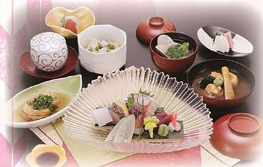
お造り盛合わせの御膳 「きときと」 ¥3,300(税込) (本体価格¥3,000)