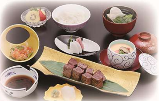
牛モモ肉の網焼き御膳 「雪吊り」 ¥2,860(税込) (本体価格¥2,600) 柔らかいヒレ肉に変更 ¥3,960(税込)