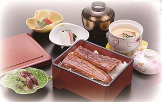
鰻重の御膳 「せせらぎ」 ¥2,640(税込) (本体価格¥2,400)