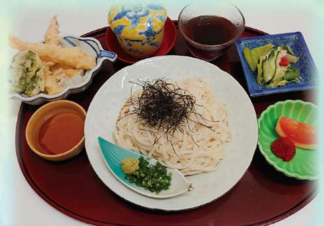
稲庭うどんと 天麩羅のお膳