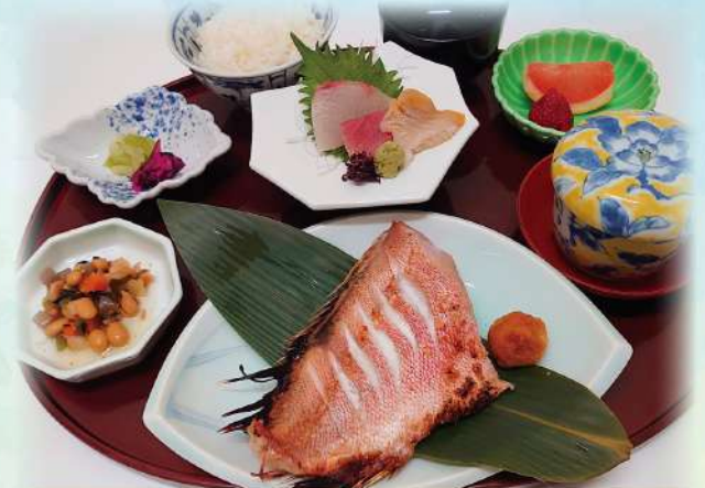
赤魚粕漬けと ミニ造りのお膳