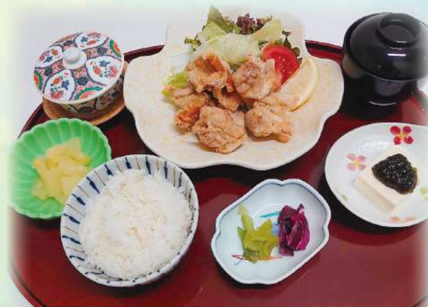
国産鳥の唐揚げ膳