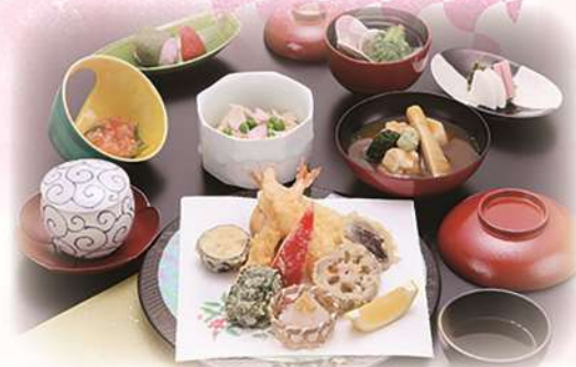
天婦羅盛合わせの御膳 「かがやき」 ¥2,860(税込) (本体価格¥2,600)