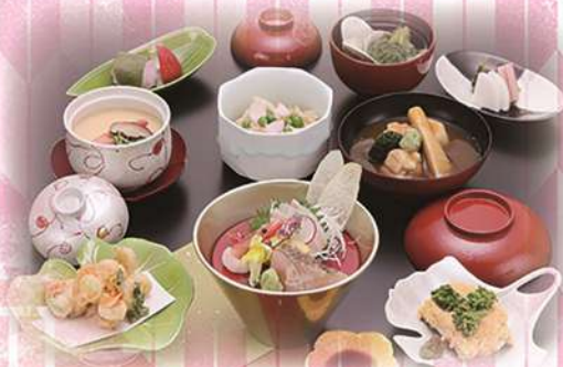
お造りと天婦羅の御膳 「四季の彩り御膳」 ¥3,630(税込) (本体価格¥3,300)

四季折々、季節の素材を用い調理しております。 加賀能登の雅の味をご堪能ください。