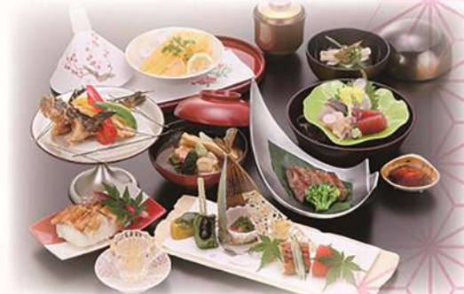
月替り会席 「雪」 ¥9,900(税込) (本体価格¥9,000) 月替り会席 「月」 ¥6,600(税込) (本体価格¥6,000) 月替り会席 「花」 ¥4,400(税込) (本体価格¥4,000) ※写真は月替り会席「雪」です。

*お米は国産を使用しております。 *ご予算・ご予約に応じて会席料理を承ります。 *料理は月替わりにてお作りしています。 *食品アレルギーのあるお客様はスタッフにお申しつけ下さいませ。