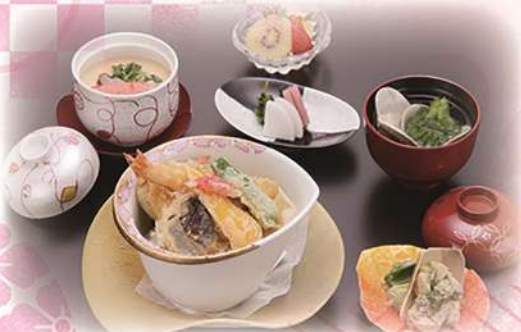
天井の御膳 「渚」 ¥1,980(税込) (本体価格¥1,800)