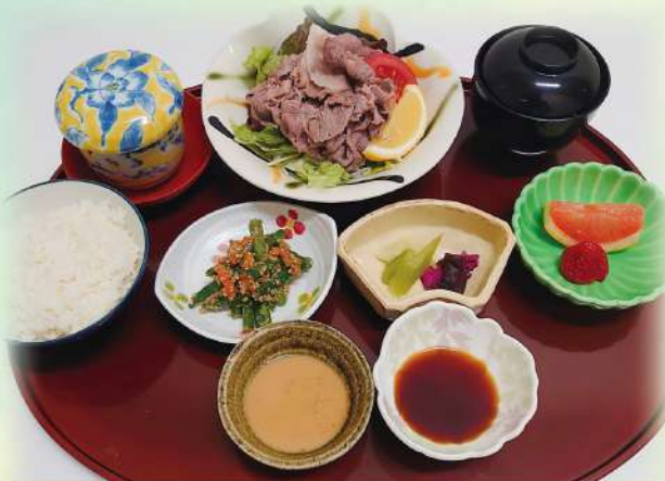
牛しゃぶサラダのお膳